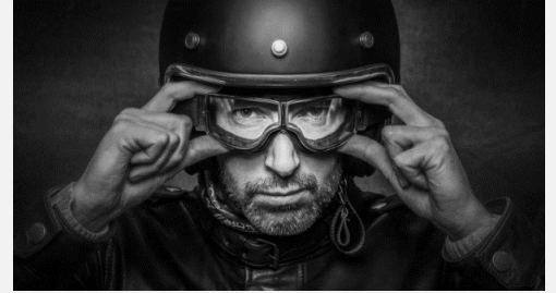
Qualität und Validierung